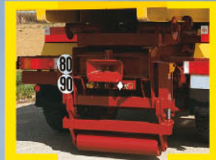
Rodillo de estabilización