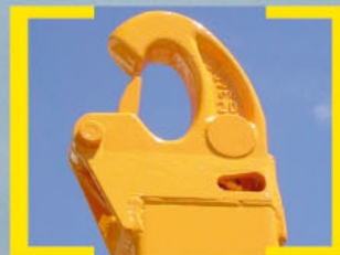
Gancho con seguridad neumática