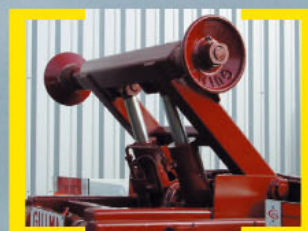
Sistema de levantador trasero de contenedor (corto)