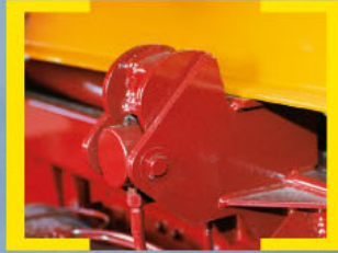
Bloqueo delantero hidráulico